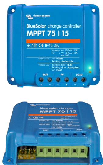
Solcellsladdningsregulator MPPT 75/15